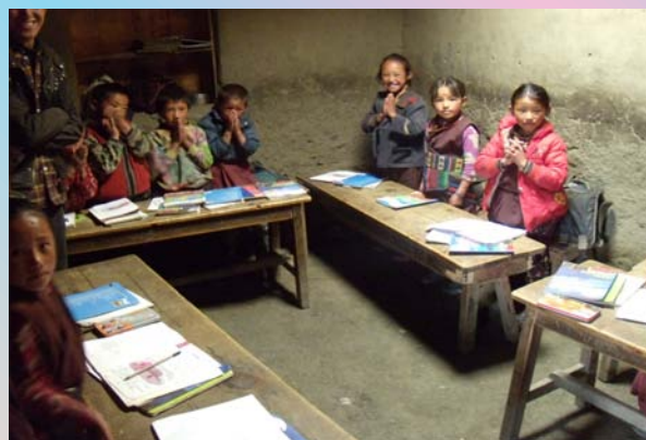
ネパール ドルポ地域 ティンギュー村の小学校