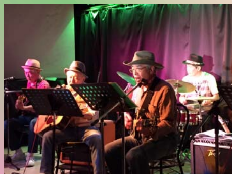
カズン あきる野市